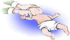
Fig. N° 1

Si no responde, coloque al niño en posición horizontal, con la cabeza hacia abajo y déle hasta 5 golpes con la mano plana entre los omóplatos (huesos triangulares de la espalda) (Fig.Nº2)